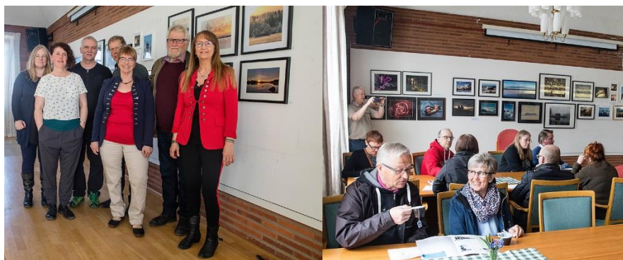
Glada fotografer i nybildade Ostriquets FK.

Snart kanske vi får se Ostriquets FK på Riksfotoutställningen! (Ostriquet – Västerbotten – ost) Red. anm.